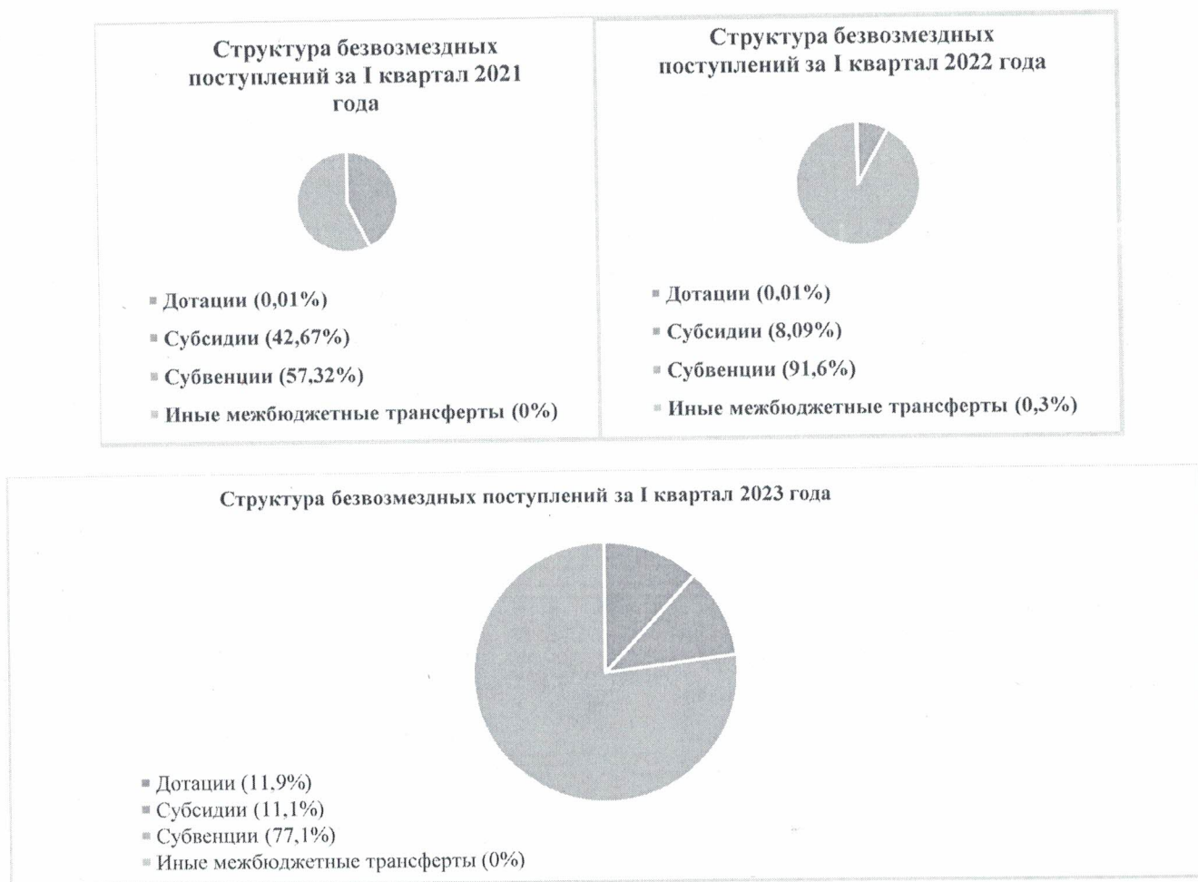
Рис.2 Диаграммы структур исполнения безвозмездных поступлений за 1 квартал 2021 года, за 1 квартал 2022 года и за 1 квартал 2023 года.

В 1 квартале 2023 года перечисления для осуществления возврата (зачета) излишне уплаченных или излишне взысканных сумм налогов, сборов и иных платежей, а также сумм процентов за несвоевременное осуществление такого товара и процентов, начисленных на излишне взысканные суммы составили (-) 48 тыс. рублей.